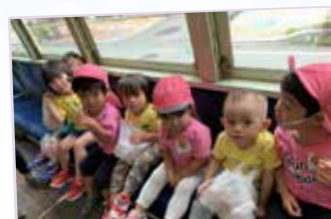
市電に乗ってお買い物