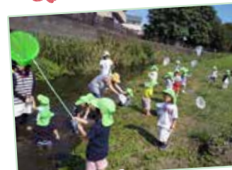
みんなで川あそび