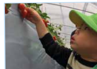
みんなでいちご狩り